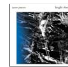
Bright Shadowz 2019