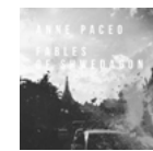
Fables of Sbrzedagon 2018