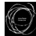
Circles live 2021