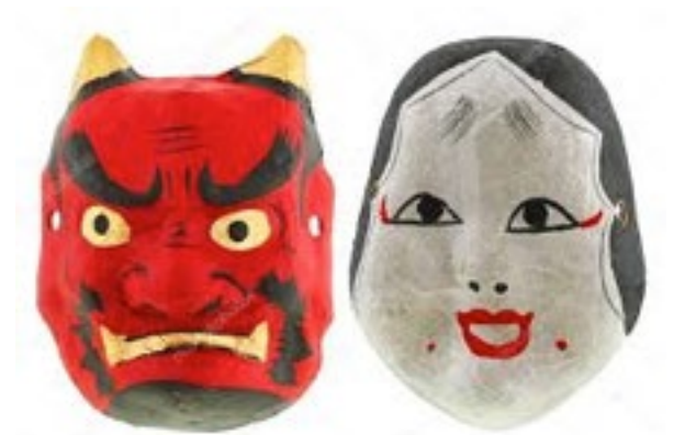
● masques japonais