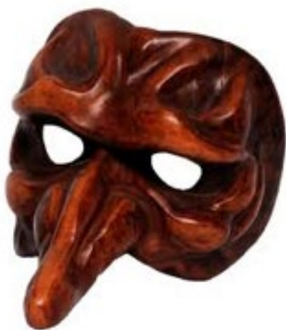
● masque italien de la Commedia dell'Arte