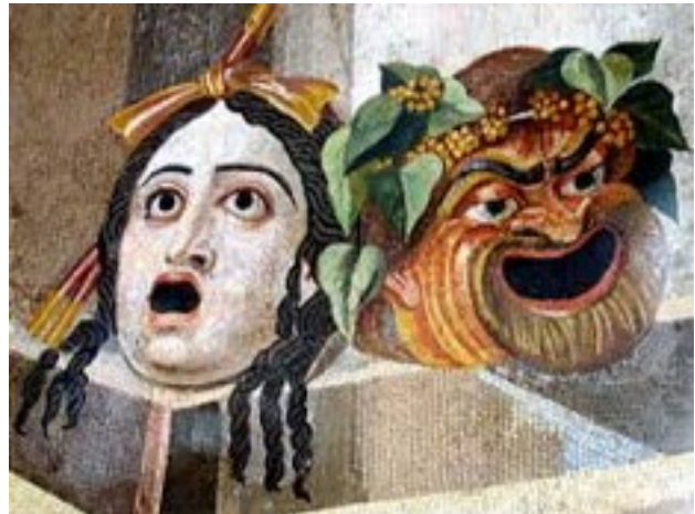
● masques de l'Antiquité